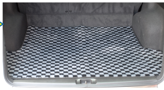
型紙通りに仕上がったチェック・グレーのカーゴマット